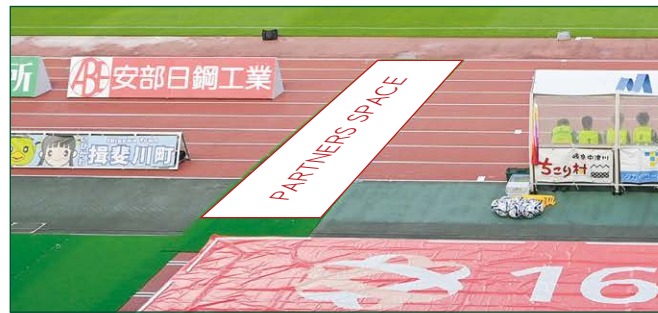
サイドロードバナー 2 枠 ●サイズ/W1m×H9.7m ●色数/カラー4色 (特色指定可) ※別途制作管理費として330,000円(税込)が加算されます。 ¥3,850,000 (税込)