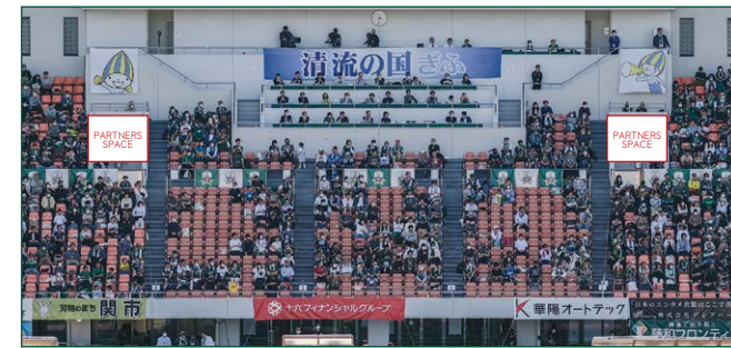
メインスタンド入場ゲートバナー 4 枠 ●サイズ/W2.1m×H2m ●色数/カラー4色 (特色指定可) ※別途制作管理費として66,000円(税込)が加算されます。 ¥550,000 (税込)