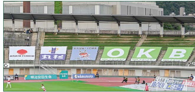
座席BIGバナー 7 枠 ●サイズ/W5.5m×H5.7m ●色数/カラー4色 (特色指定可) ※別途制作管理費として275,000円(税込)が加算されます。 ¥3,300,000 (税込)