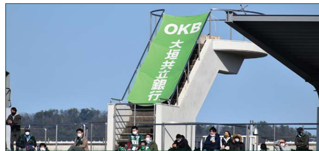
聖火台バナー 1 枠 ●サイズ/W1.7m×H4.3m ●色数/カラー4色 (特色指定可) ※別途制作管理費として110,000円(税込)が加算されます。 ¥2,200,000 (税込)