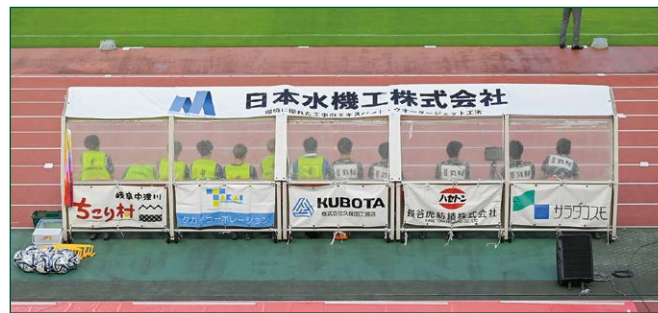
ベンチバナー 大2 枠 小10 枠 ●サイズ/大: W7.3m×H0.9m/小: W1.35m×H0.6m ●色数/カラー4色 (特色指定可) (大) ¥3,300,000 (税込) (小) ¥550,000 (税込) ※別途制作管理費として大: 330,000円(税込)、小: 55,000円(税込)が加算されます。