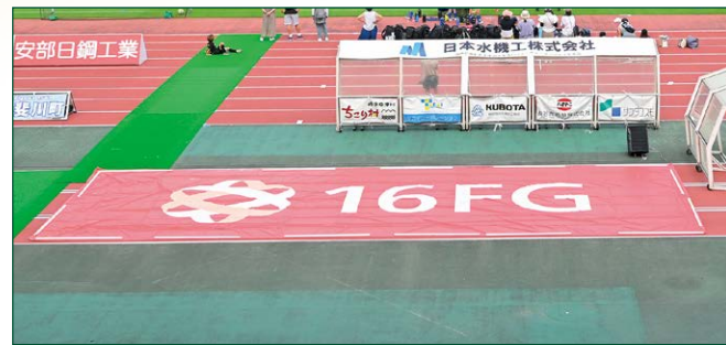
アップゾーンバナー 2 枠 ●サイズ/W12m×H4m ●色数/カラー4色 (特色指定可) ※別途制作管理費として550,000円(税込)が加算されます。 ¥3,850,000 (税込)