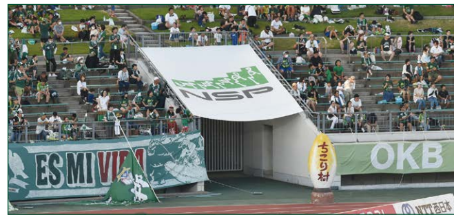
バックスタンドコーナーバナー 2 枠 ●サイズ/W5.05m×H6.2m ●色数/カラー4色 (特色指定可) ※別途制作管理費として385,000円(税込)が加算されます。 ¥3,300,000 (税込)