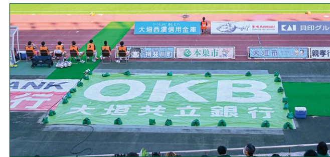
砂場 BIG バナー 2 枠 ●サイズ/W9.9m×H6.5m ●色数/カラー4色 (特色指定可) ※別途制作管理費として440,000円(税込)が加算されます。 (メイン) ¥1,650,000 (税込)