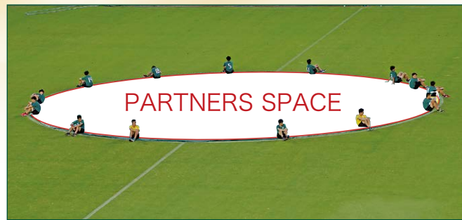
センターサークル BIG バナー 1 枠 ●サイズ/直径20m ●色数/カラー4色 (特色指定可) ※別途制作管理費として2,200,000円(税込)が加算されます。 ¥5,500,000 (税込)