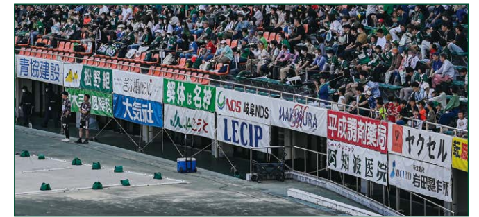
メインスタンド・ゴール裏バナー 50 枠 ●サイズ/W4.5m×H0.9m ●色数/カラー4色 (特色指定可) ※別途制作管理費として66,000円(税込)が加算されます。 ¥550,000 (税込)