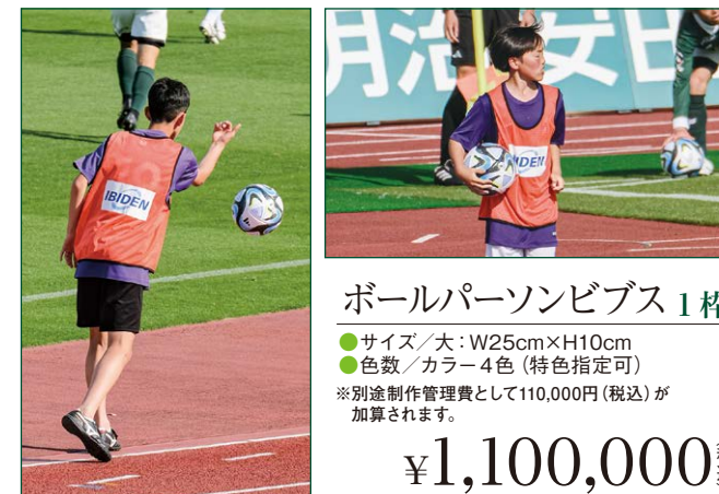
ボールパーソンビブス 1 枠 ●サイズ/大: W25cm×H10cm ●色数/カラー4色 (特色指定可) ※別途制作管理費として110,000円(税込)が加算されます。 ¥1,100,000 (税込)