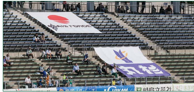
緩衝帯バナー 2 枠 ●サイズ/W5.5m×H5.7m ●色数/カラー4色 (特色指定可) ※別途制作管理費として275,000円(税込)が加算されます。 ¥3,300,000 (税込)