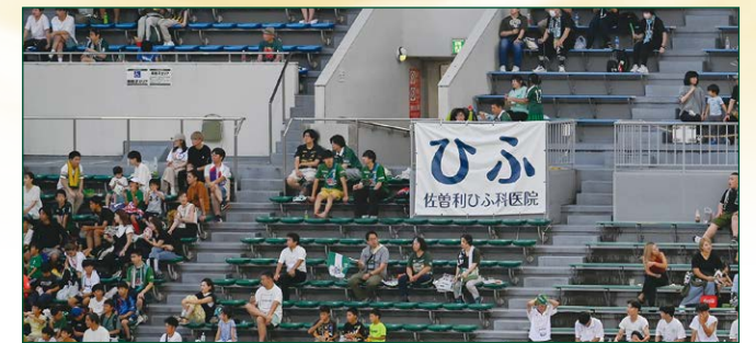
車いす席サイドバナー 各2 枠 ●サイズ/大: W4.9m×H1.6m/小: W2.4m×H1.6m ●色数/カラー4色 (特色指定可) (大) ¥1,100,000 (税込) (小) ¥550,000 (税込) ※別途制作管理費として大: 110,000円(税込)、小: 66,000円(税込)が加算されます。