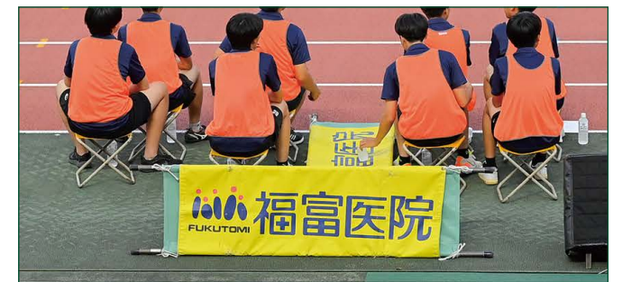
担架バナー 2 枠 ●サイズ/W1.636m×H0.65m ●色数/カラー4色 (特色指定可) ※別途制作管理費として110,000円(税込)が加算されます。 ¥1,100,000 (税込)