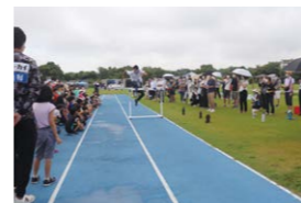
デモンストレーション