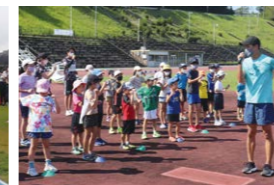
走るときの正しい姿勢とは？