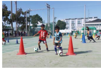
ドリブル・パスなどのトレーニング