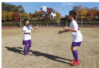
ボールフィーリング