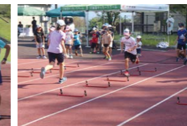
足の接地・腕の振り方