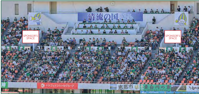
メインスタンド入場ゲートバナー 4 枠 ●サイズ/W2.1m×H2m ●色数/カラー4色 (特色指定可) ※別途制作管理費として66,000円(税込)が加算されます。 ¥550,000 (税込)