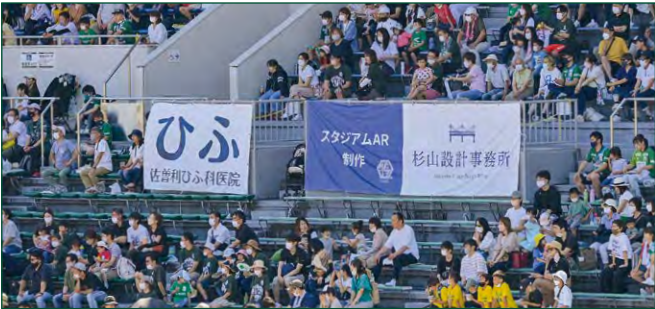
車いす席サイドバナー 各2 枠 ●サイズ/大:W4.9m×H1.6m/小:W2.4m×H1.6m ●色数/カラー4色 (特色指定可) ※別途制作管理費として大:110,000円(税込)、小:66,000円(税込)が加算されます。 (大) ¥1,100,000 (税込) (小) ¥550,000 (税込)