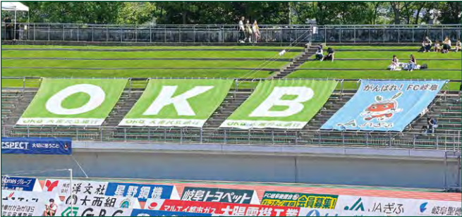
座席BIGバナー 7 枠 ●サイズ/W5.5m×H5.7m ●色数/カラー4色 (特色指定可) ※別途制作管理費として275,000円(税込)が加算されます。 ¥3,300,000 (税込)