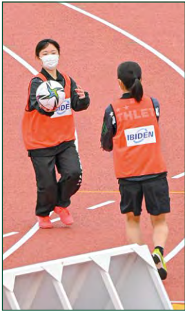
ボールパーソンビブス 1 枠 ●サイズ/大:W25cm×H10cm ●色数/カラー4色 (特色指定可) ※別途制作管理費として110,000円(税込)が加算されます。 ¥1,100,000 (税込)