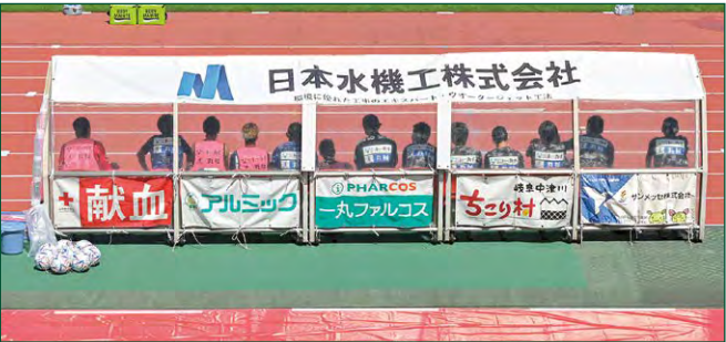
ベンチバナー 大2 枠 小10 枠 ●サイズ/大:W7.3m×H0.9m/小:W1.35m×H0.6m ●色数/カラー4色 (特色指定可) ※別途制作管理費として大:330,000円(税込)、小:55,000円(税込)が加算されます。 (大) ¥3,300,000 (税込) (小) ¥550,000 (税込)