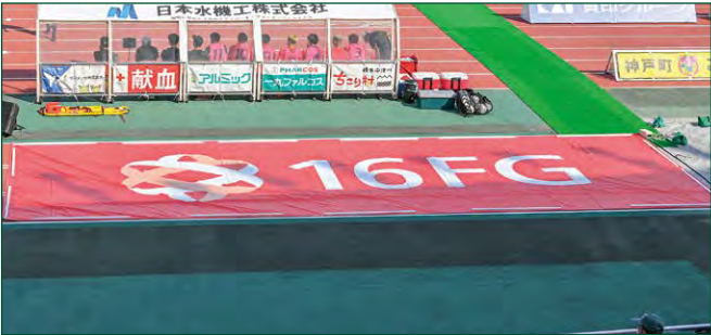
アップゾーンバナー 2 枠 ●サイズ/W12m×H4m ●色数/カラー4色 (特色指定可) ※別途制作管理費として550,000円(税込)が加算されます。 ¥3,850,000 (税込)