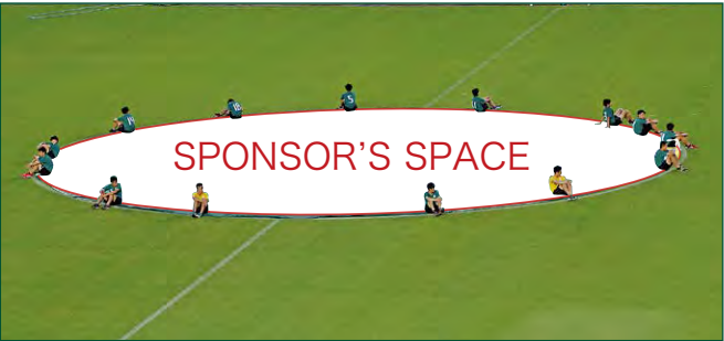
センターサークル BIG バナー 1 枠 ●サイズ/直径20m ●色数/カラー4色 (特色指定可) ※別途制作管理費として2,200,000円(税込)が加算されます。 ¥5,500,000 (税込)