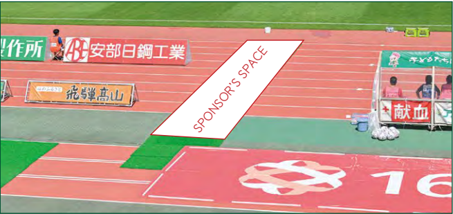
サイドロードバナー 2 枠 ●サイズ/W1m×H9.7m ●色数/カラー4色 (特色指定可) ※別途制作管理費として330,000円(税込)が加算されます。 ¥3,850,000 (税込)