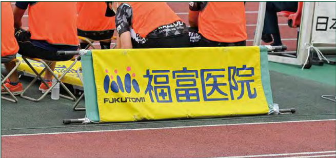
担架バナー 2 枠 ●サイズ/W1.636m×H0.65m ●色数/カラー4色 (特色指定可) ※別途制作管理費として110,000円(税込)が加算されます。 ¥1,100,000 (税込)