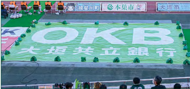
砂場 BIG バナー 2 枠 ●サイズ/W9.9m×H6.5m ●色数/カラー4色 (特色指定可) ※別途制作管理費として440,000円(税込)が加算されます。 (メイン) ¥1,650,000 (税込)