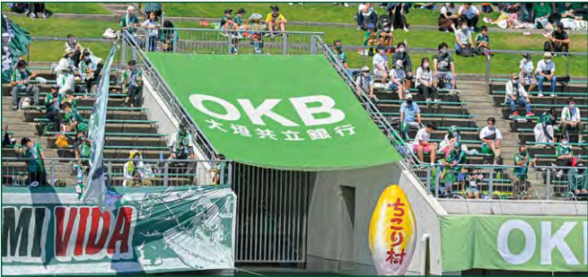
バックスタンドコーナerbナー 2 枠 ●サイズ/W5.05m×H6.2m ●色数/カラー4色 (特色指定可) ※別途制作管理費として385,000円(税込)が加算されます。 ¥3,300,000 (税込)