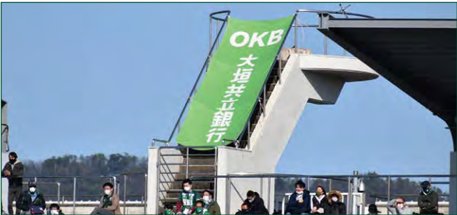
聖火台バナー 1 枠 ●サイズ/W1.7m×H4.3m ●色数/カラー4色 (特色指定可) ※別途制作管理費として110,000円(税込)が加算されます。 ¥2,200,000 (税込)