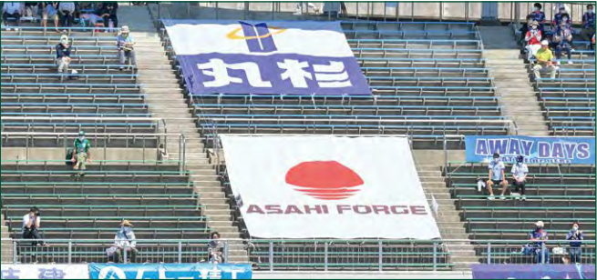
緩衝帯バナー 2 枠 ●サイズ/W5.5m×H5.7m ●色数/カラー4色 (特色指定可) ※別途制作管理費として275,000円(税込)が加算されます。 ¥3,300,000 (税込)