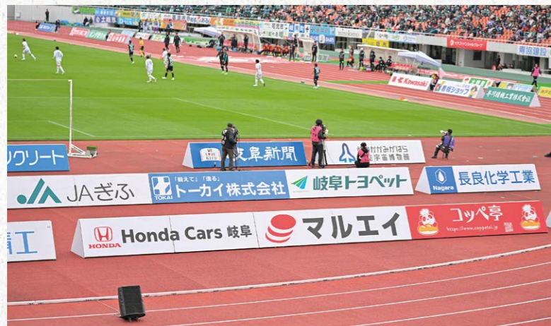
ゴール裏看板 各 24枠

●サイズ/W4.5m×H0.9m (両面) ●色数/カラー4色 (特色指定可) ※新規の場合は別途制作管理費として330,000円(税込)が加算されます。 ※看板の張り替えの場合は別途制作管理費として220,000円(税込)が加算されます。 ※2・3・4列目 ローテーション