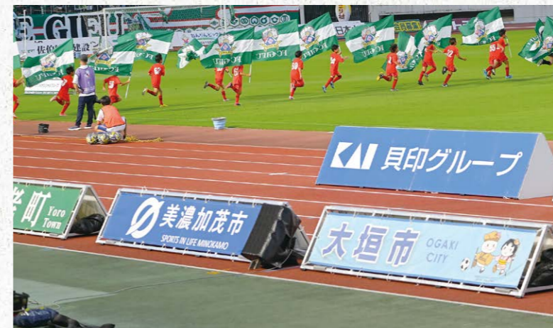
ホームタウン看板 12枠

(2・3・4列目) ¥880,000 (税込) (J2参戦価格: ¥1,100,000 (税込))