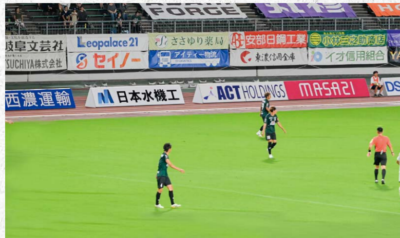
バックスタンドフィールド看板 1列目 14枠 2列目 12枠

●サイズ/W4.5m×H0.9m (両面) ●色数/カラー4色 (特色指定可) ※新規の場合は別途制作管理費として330,000円(税込)が加算されます。 ※看板の張り替えの場合は別途制作管理費として220,000円(税込)が加算されます。