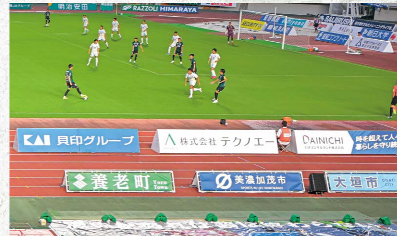
メインスタンドフィールド看板 10枠

(2列目) ¥2,640,000 (税込) (J2参戦価格: ¥3,300,000 (税込))