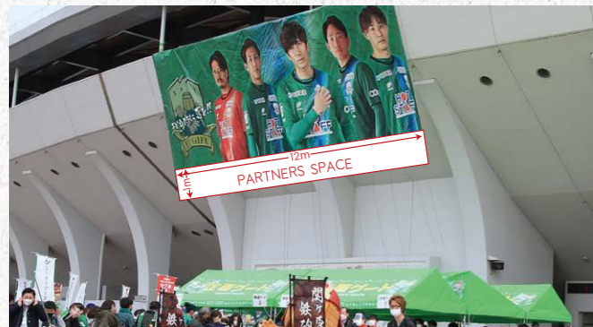
スタジアム入り口バナー 1 枠

Jリーグ公式戦のFC岐阜ホームゲームにおけるスタジアム周辺に企業ロゴ（社名や商品名が使用可能）を掲出します。屋台村をはじめスタジアム周辺は試合前イベントなど多くの来場者で賑わうため、高い広告効果が期待できます。