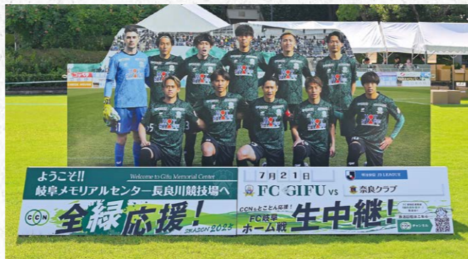
グリーティングパートナー 1 枠

●バナーサイズ/W12m×H6m 広告サイズ/W12m×H1m ●色数/カラー4色(特色指定可) 制作費込 ¥6,160,000 (税込) (J2参戦価格: ¥7,700,000 (税込))