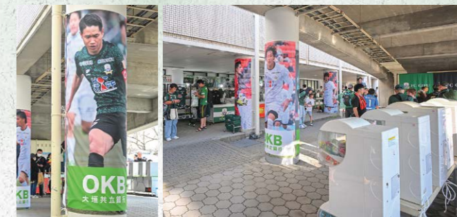
グッズショップ選手バナーパートナー 7 枠

●バナーサイズ/W237cm×H237cm 広告サイズ/W110cm×50cm ●色数/カラー4色 ※別途制作管理費として55,000円(税込)が加算されます。 ¥264,000 (税込) (J2参戦価格: ¥330,000 (税込))