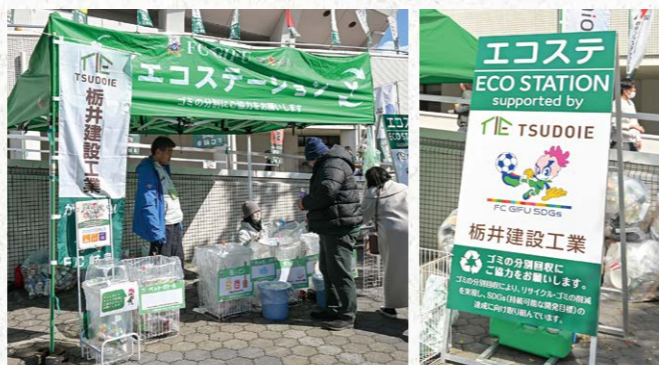
エコステーションパートナー 1 枠

●サイズ/W0.9m×H1.8m ●色数/カラー4色(特色指定可) ※別途制作管理費として330,000円(税込)が加算されます。 ¥880,000 (税込) (J2参戦価格: ¥1,100,000 (税込))