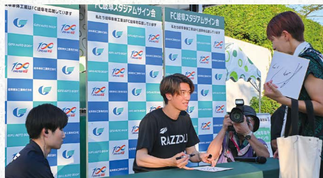
サイン会パートナー 1 枠

●サイズ/W3.64m×H2m ●色数/カラー4色(特色指定可) ※別途制作管理費として440,000円(税込)が加算されます。 ※デザインはイメージです。 ¥880,000 (税込) (J2参戦価格: ¥1,100,000 (税込))