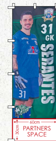
選手のぼりパートナー 枠:全選手、監督分

●のぼりサイズ/W60cm×H180cm 広告サイズ/W60cm×H120cm ●色数/カラー4色 ●数量/1口あたり3本 ※制作管理費込みとなります。 ¥281,600 (税込) (J2参戦価格: ¥352,000 (税込))