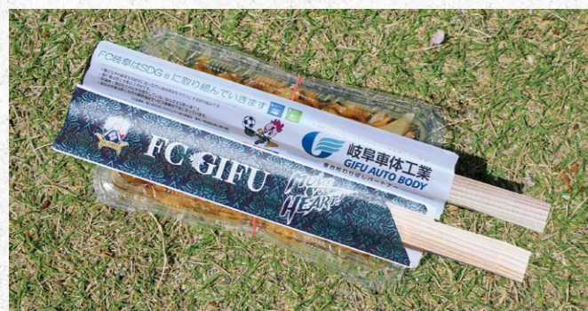
屋台村わりばしパートナー 1 枠

●サイズ/W0.9m×H1.8m ●色数/カラー4色(特色指定可) ※別途制作管理費として165,000円(税込)が加算されます。 ¥880,000 (税込) (J2参戦価格: ¥1,100,000 (税込))