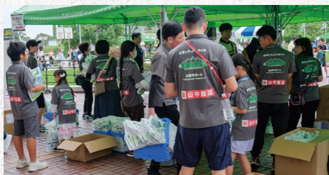
ボランティアスタッフビブス 1 枠

●サイズ/要調整 ●色数/カラー4色 ●数量/年間約45,000本 ※別途制作管理費として110,000円(税込)が加算されます。 ¥440,000 (税込) (J2参戦価格: ¥550,000 (税込))